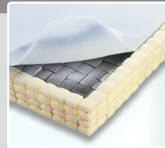
Würfel-Matratze mit Softschaum-Auflage