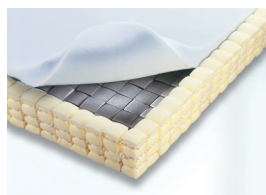
12 cm – zweischichtig