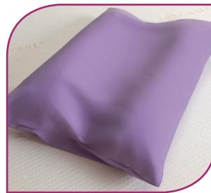
Individuell modellierbar bei hoher Formstabilität