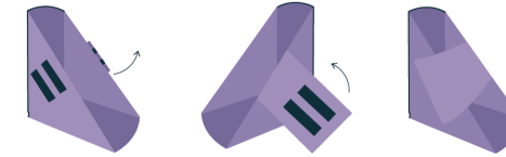
Schematische Illustration eines Fersenschuhs